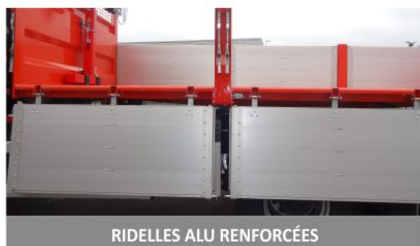
RIDELLES ALU RENFORCÉES