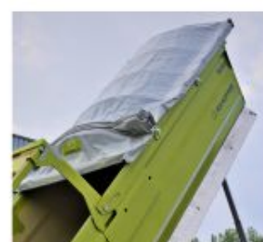
BÂCHE ÉLECTRIQUE (CRAMARO/MARCOLIN)